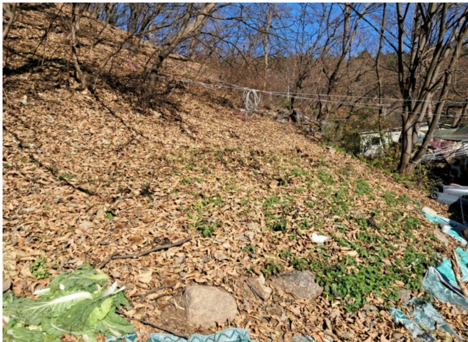
육안상 봉분이 뚜렷하지 않은 분묘 2기