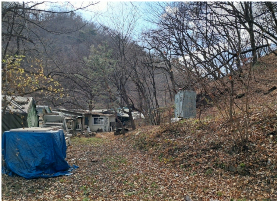
타인 점유 추정 부분 (남측)