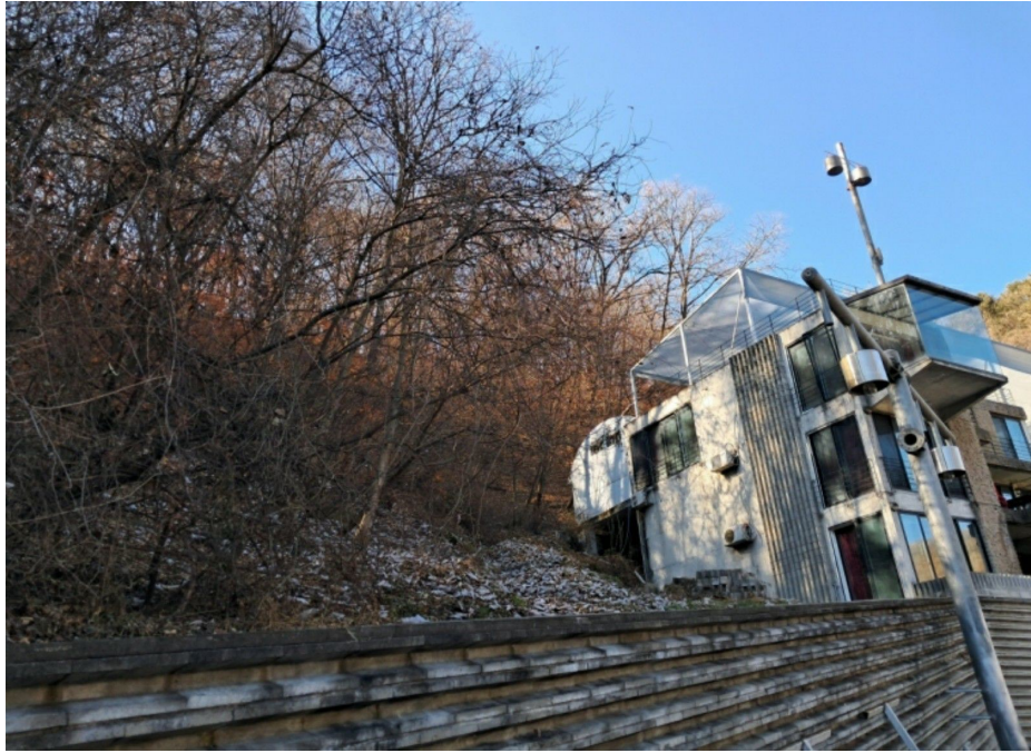
타인 점유 추정 부분 (북측)