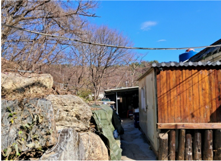
타인 점유 추정 부분 (남측)