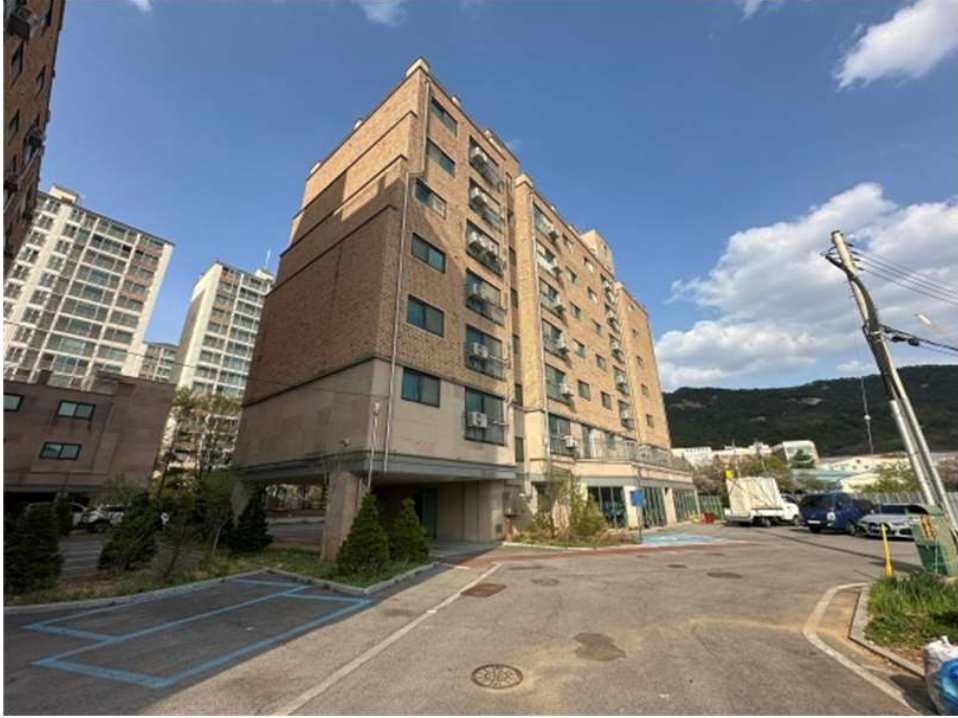
본건 건물 전경