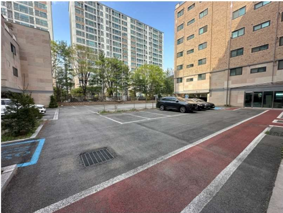
본건 건물 지상 주차장 전경