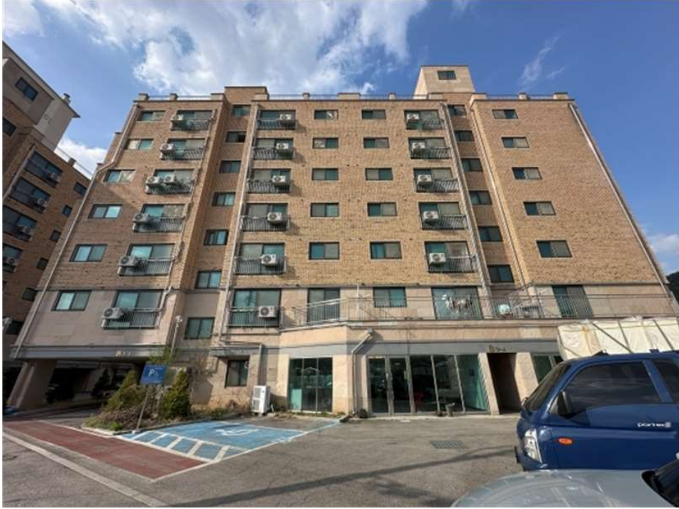
본건 건물 전경