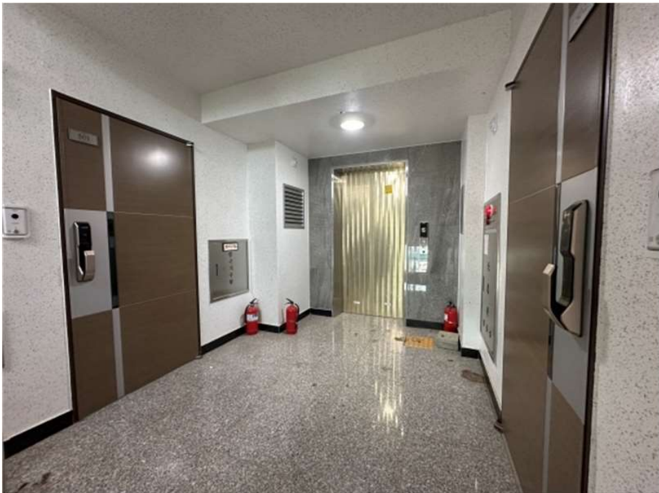
본건 건물 1,2호 라인 5층 복도 전경