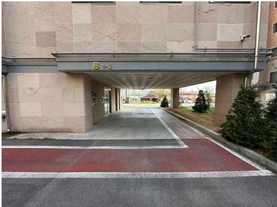
본건 건물 1층 전경