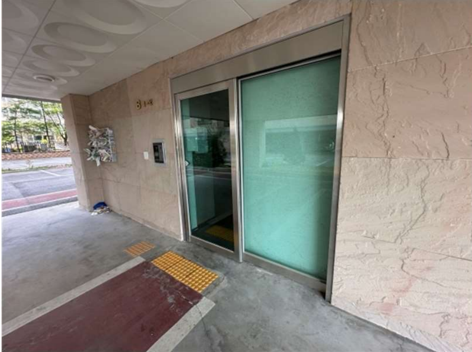
본건 건물 1,2호 라인 1층 출입구 전경