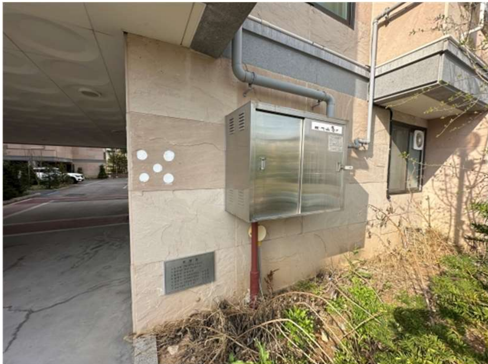
본건 건물 1층 전경