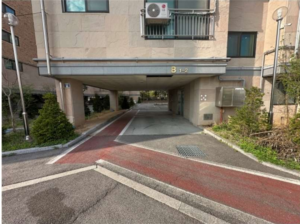
본건 건물 1층 전경