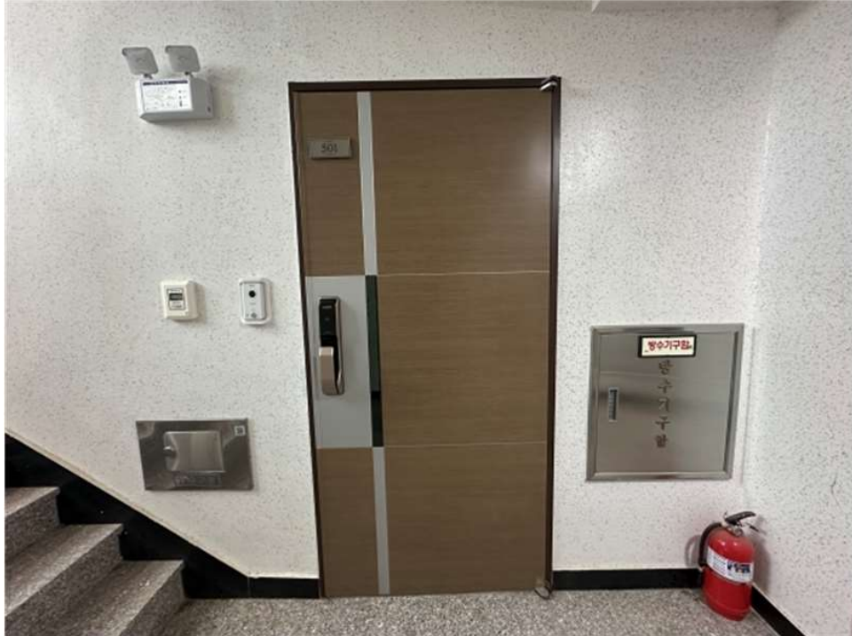
본건 출입문(501호) 전경