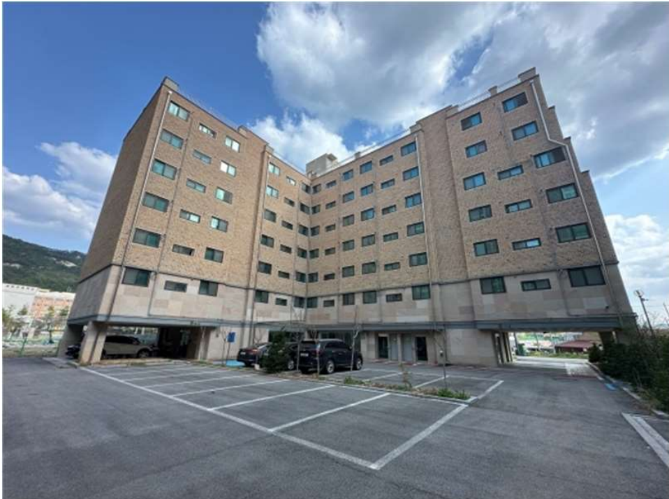
본건 건물 전경