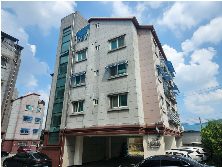
본건 동 전경