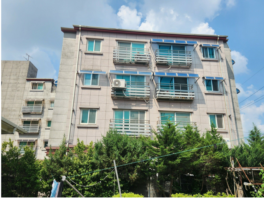
본건 동 전경