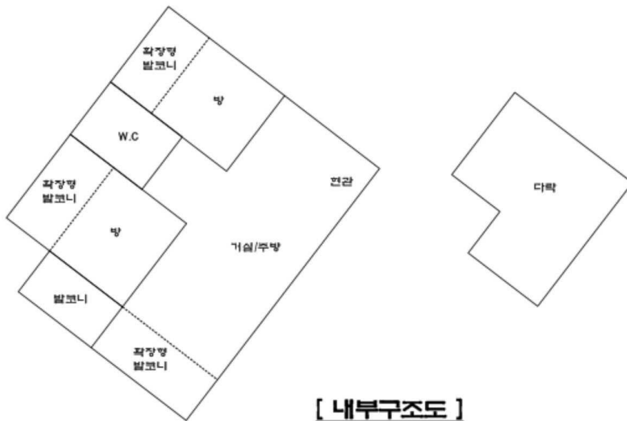
[ 내부구조도 ]