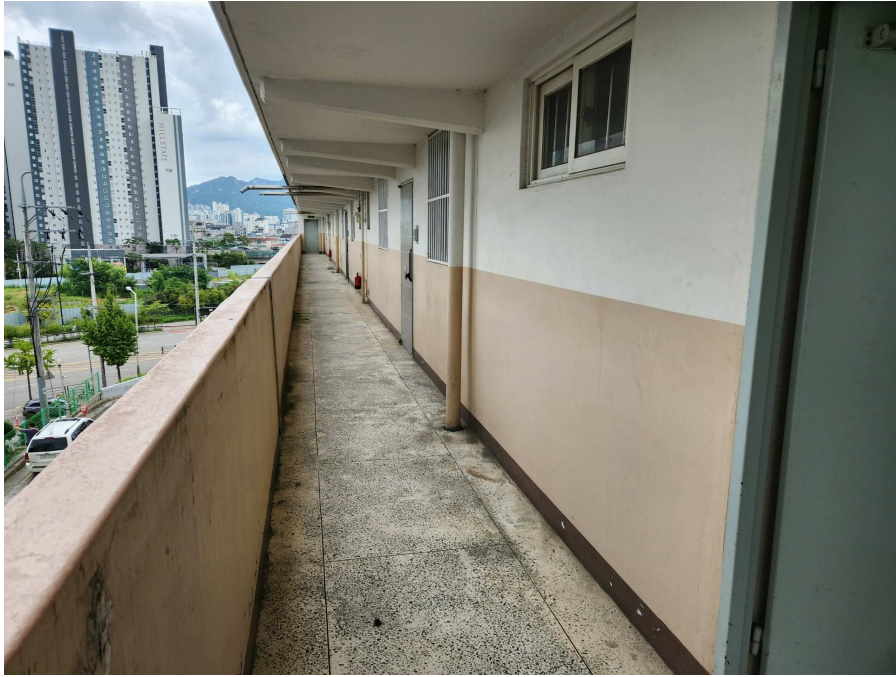
본건 출입 복도