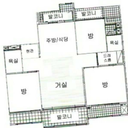
[ 신도브래뉴아파트 109동 7층 704호 내부구조도 ]