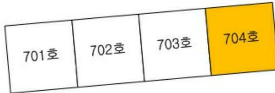
[ 신도브래뉴아파트 109동 7층 호별배치도 ]