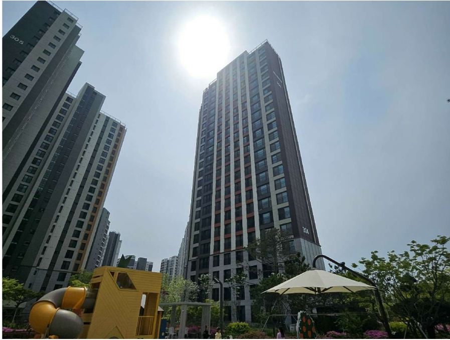
본건 동 전경