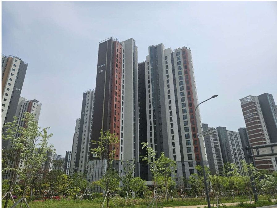
본건 동 전경