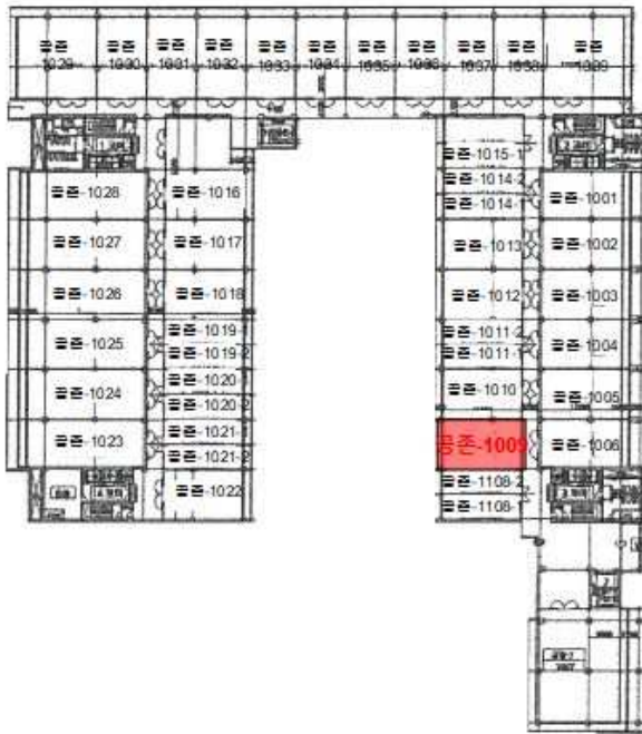
[ 호별배치도 ]