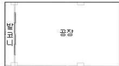
[ 내부구조도 ]

(임대관계는 미상이며, 내부구조는 거주인의 부재로 확인하지 못하여 외부관찰 및 인근 탐문조사, 집합건축물대상상 건축물현황도 등에 의거 도시하였는바, 귀 원 경매 진행시 참고바람.)