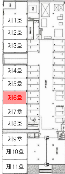
< 누메르 제비동 제지1층 호별배치도 >