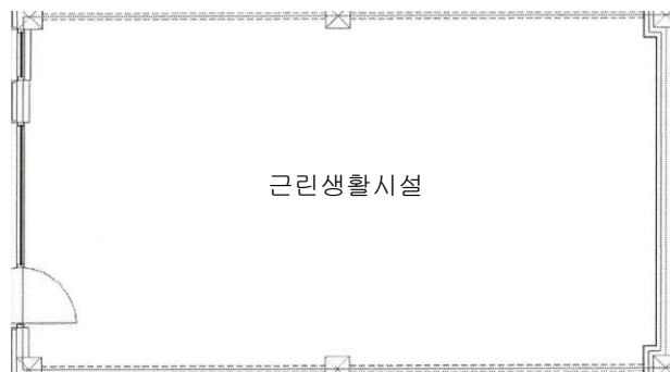
< 누메르 제비동 제지1층 제6호 내부구조도 >