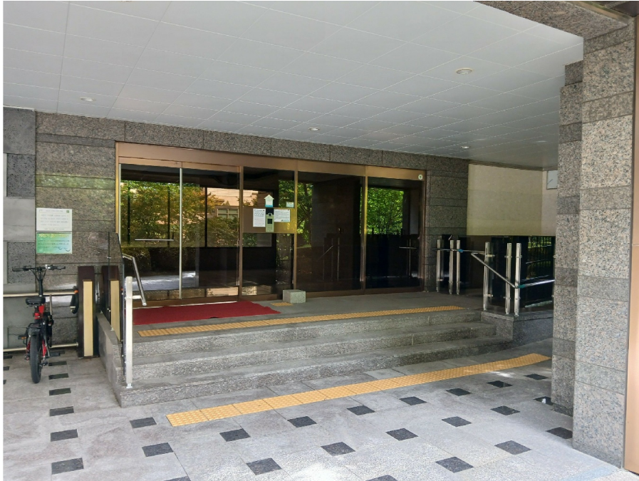
[ 507 ]