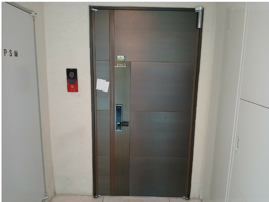
[ 1903 ]