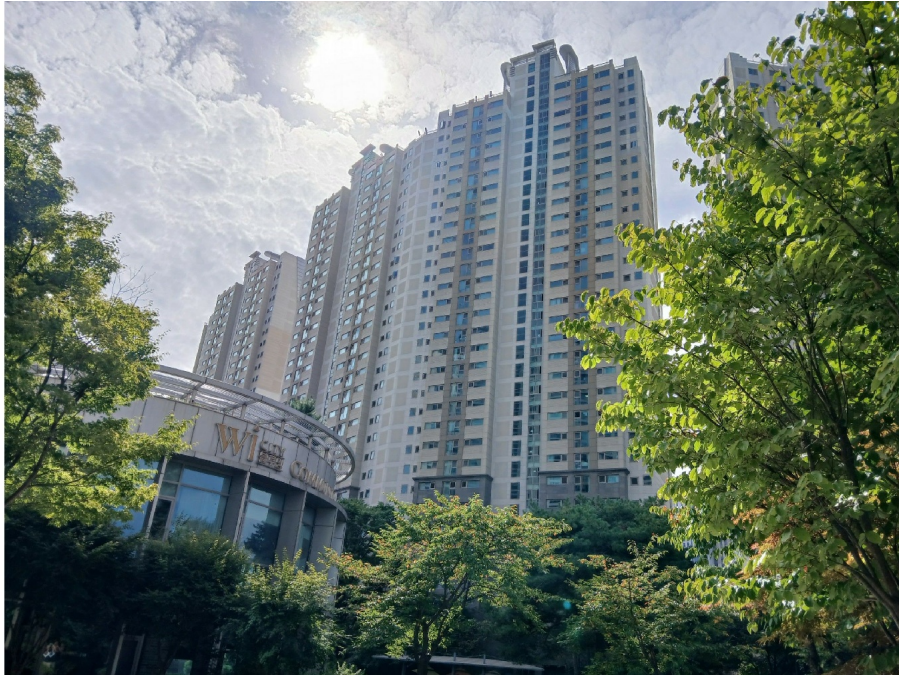
[ 507 (1) ]