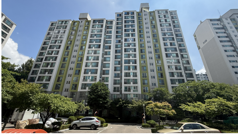
본건 소재 건물(제505동) 전경

경기도 고양시 일산서구 주엽동 49 강선마을 제505동 제10층 제1001호