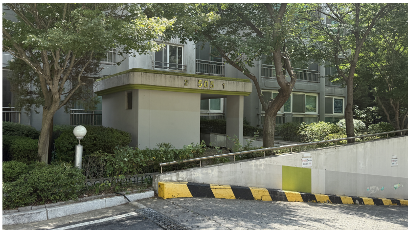
본건 공동 현관