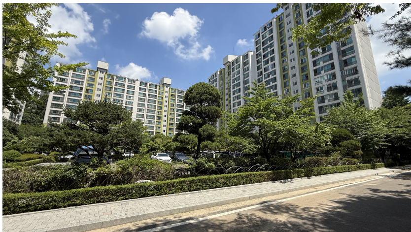
본건 단지 내 전경