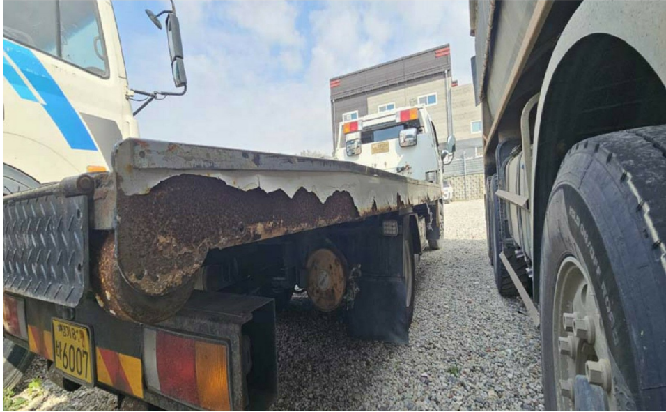
[ ( ) ]