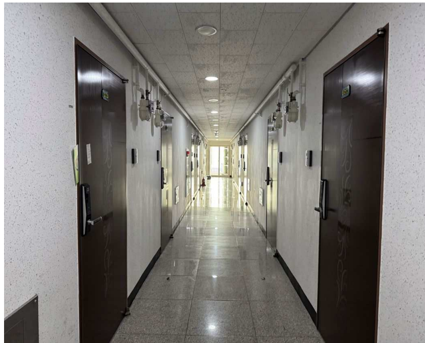
대상물건 소재 복도