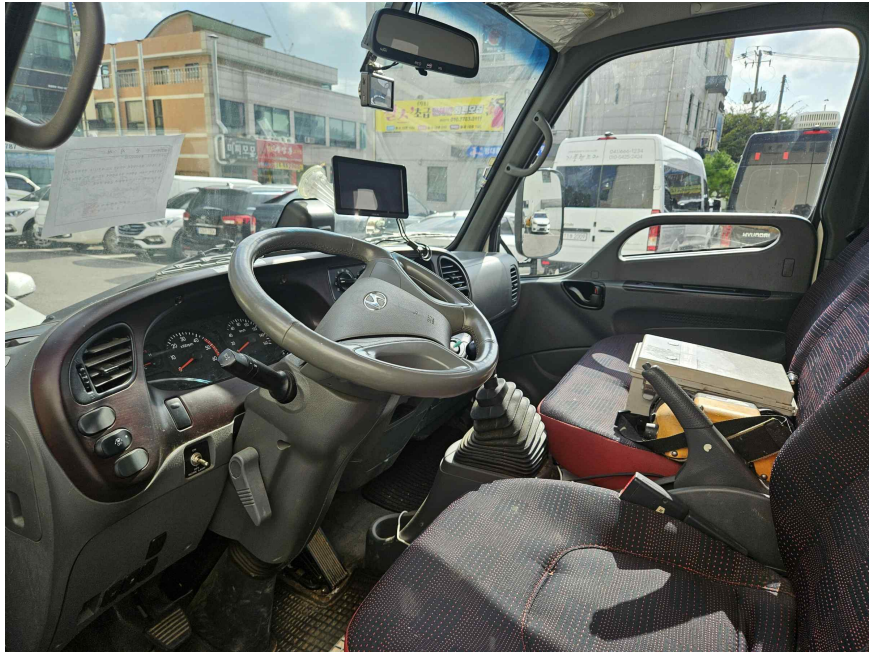
본건 운전석 내부