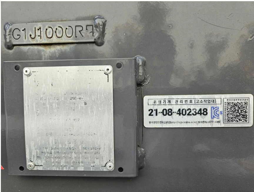
본건 고소작업대 관리번호