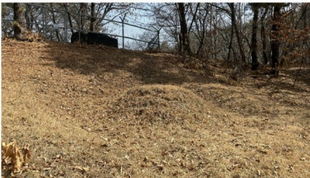
[기호(2) 소재 분묘부분]