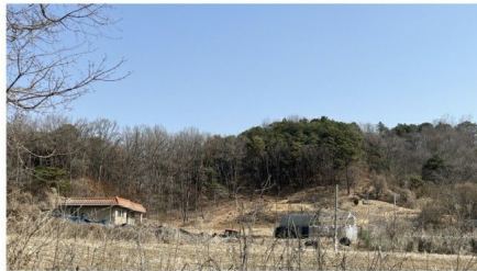
[기호(1),(2) 소재 임야 전경]