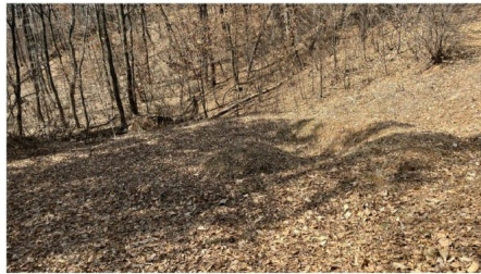
[기호(1) 소재 분묘부분]