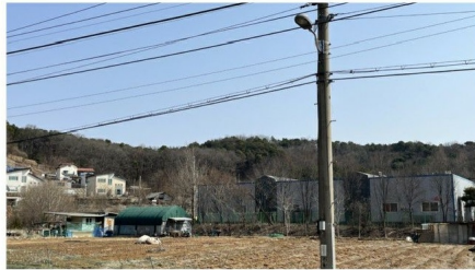
[기호(1),(2) 소재 임야 전경]