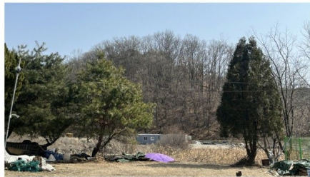
[기호(1),(2) 소재 임야 전경]