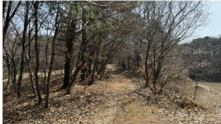
[임도 및 기호(1)의 일부]