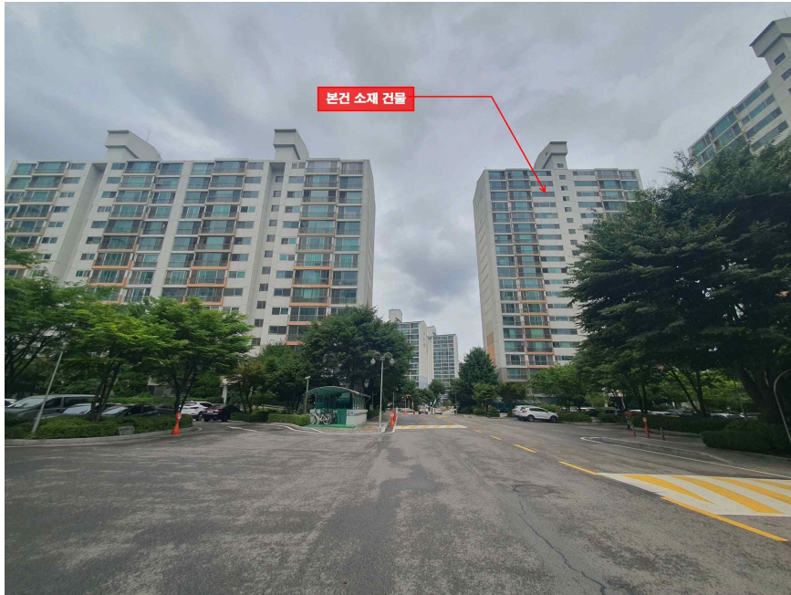
주 위 환 경