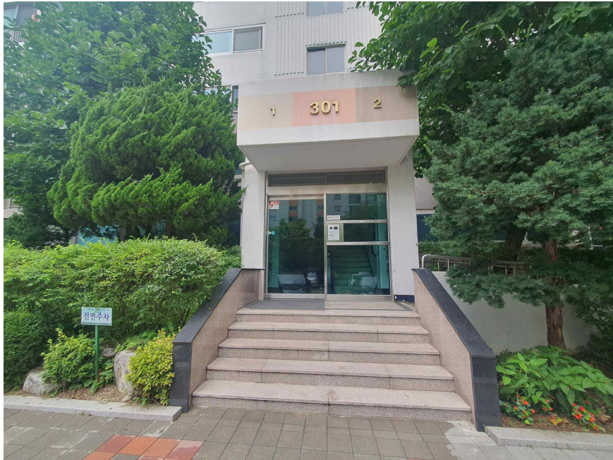
본건 1층 공동현관