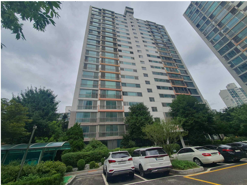
본 건 전 경