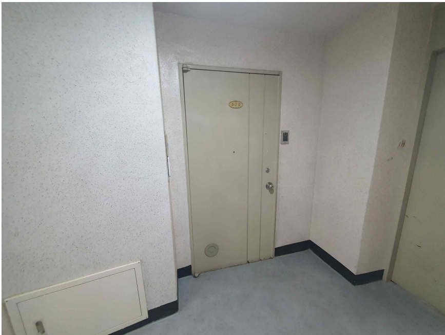
본 건 현 관