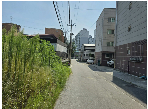
대상물건 단지 주위전경