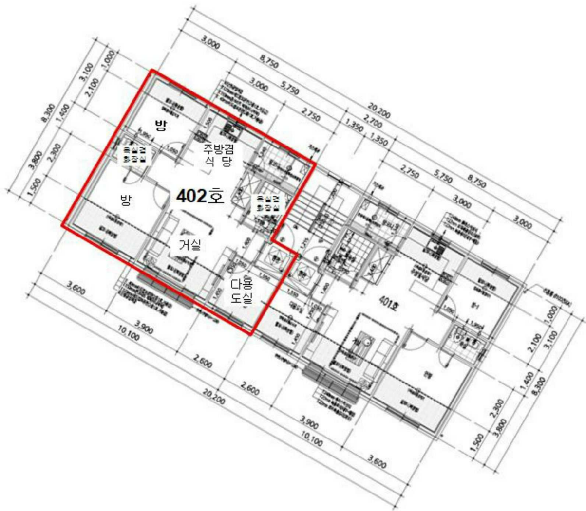
< 애플트리 제2동 제4층 제402호 >