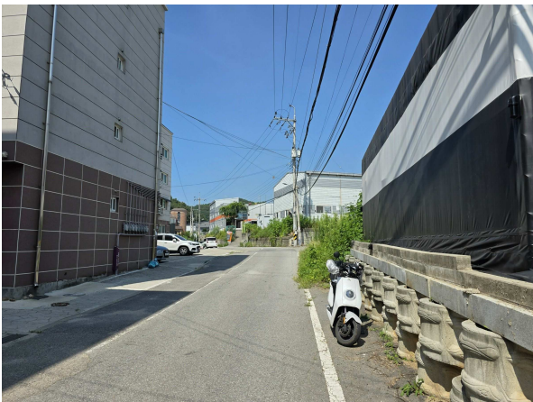
대상물건 단지 주위전경