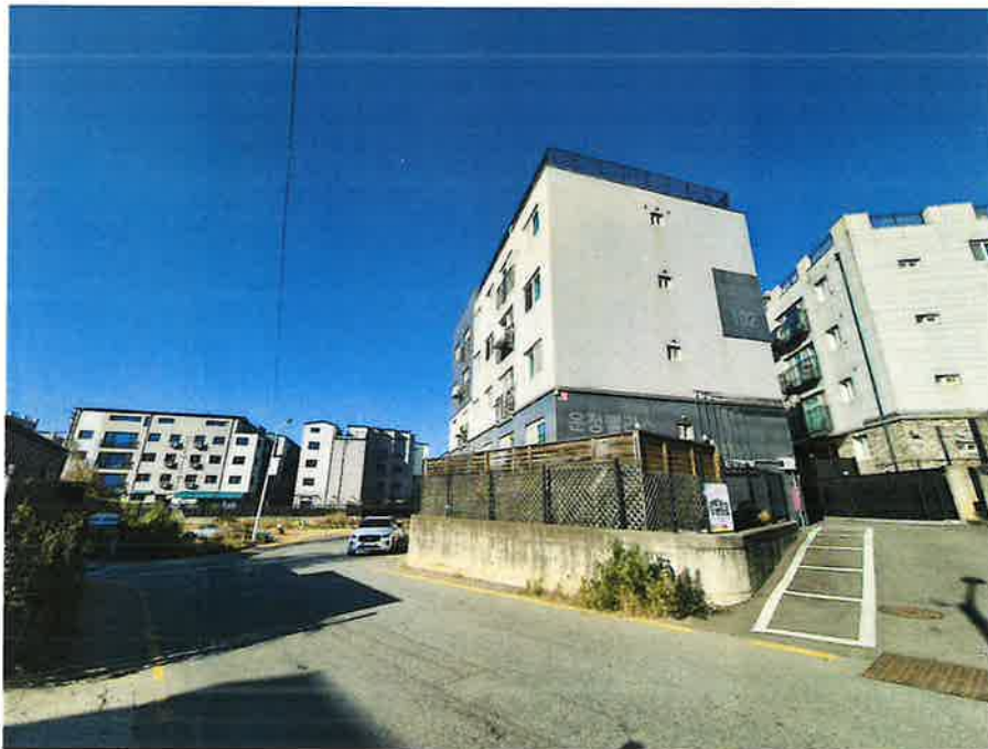
본건 및 주위환경