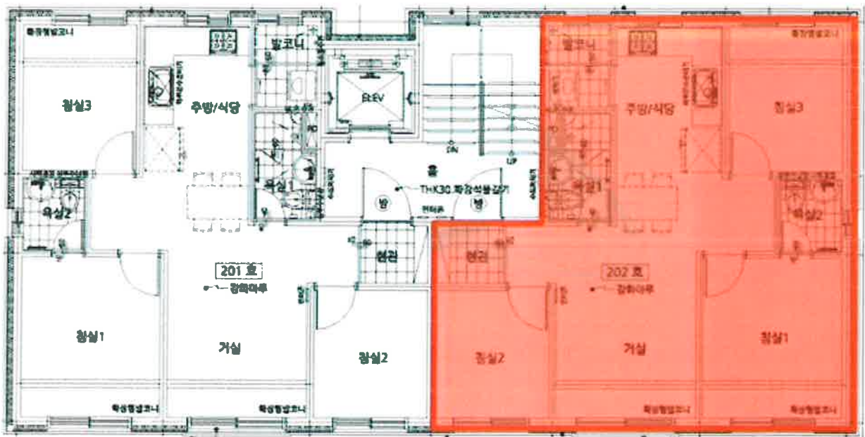
[ 102동 제2층 제202호 ]