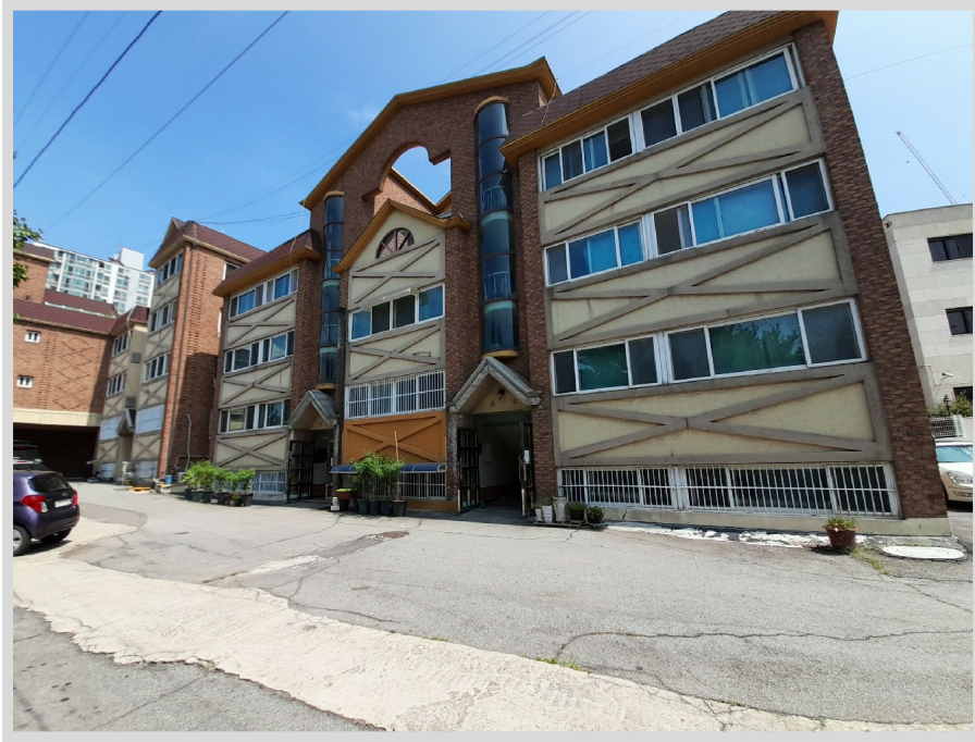
[ - ]