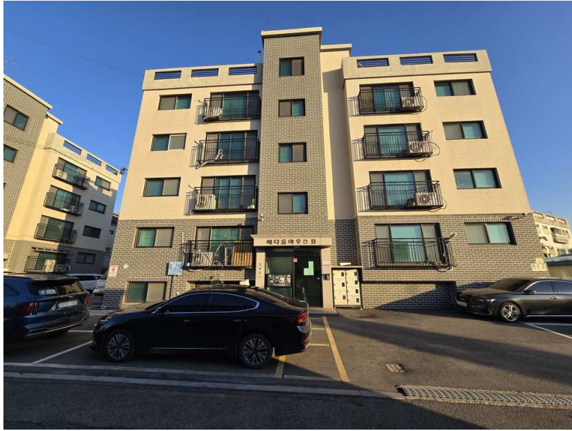
예다움하우스 제2동 전경