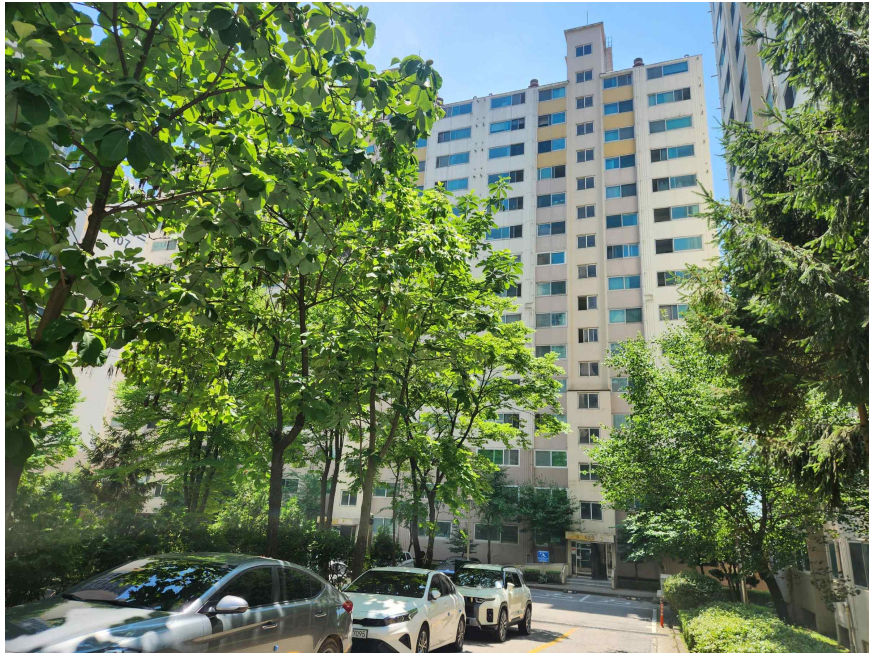
본건 소재 동