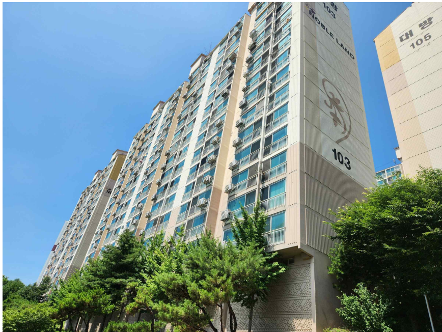
본건 소재 동