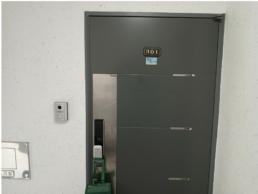
[ 301 ]