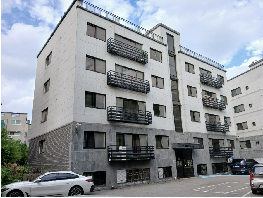
[ 102 (1) ]