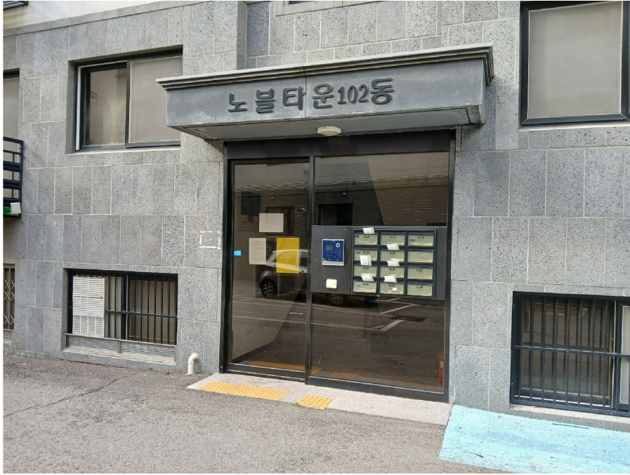
[ 102 ]