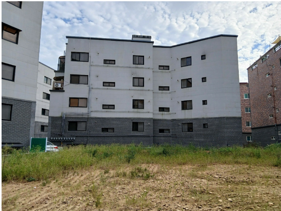
[ 102 (2) ]