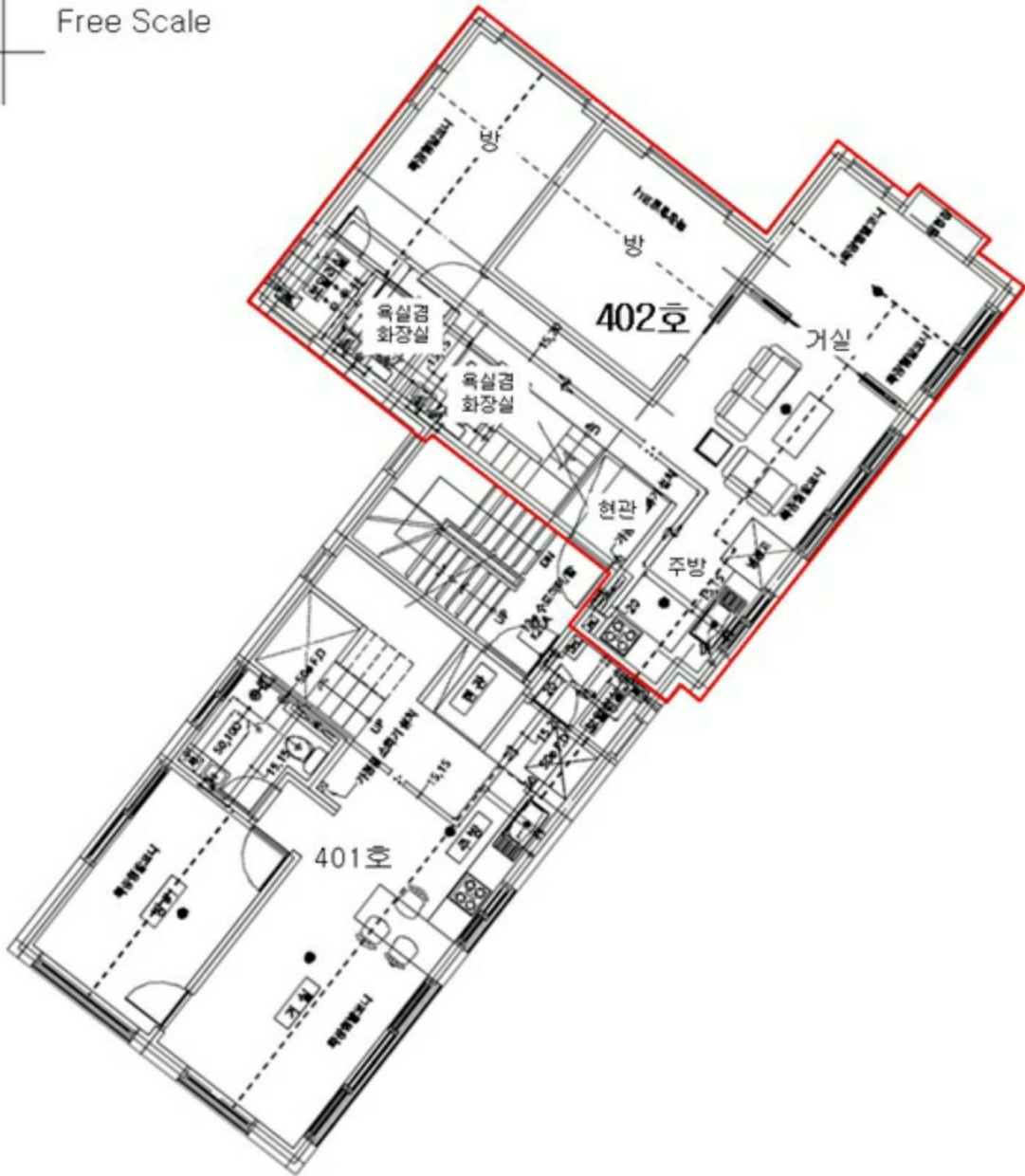
< 제4층 제402호 >