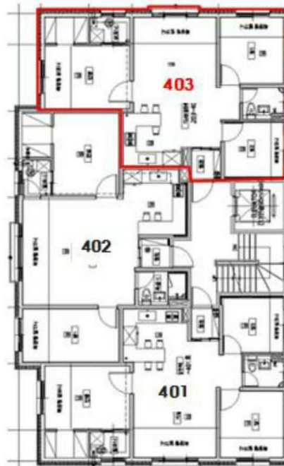
[아침의뜰1차 제4층 호별배치도]