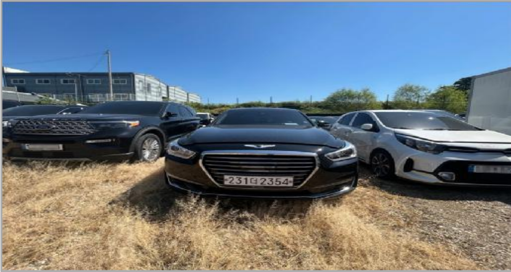
본건 전경 (전면)