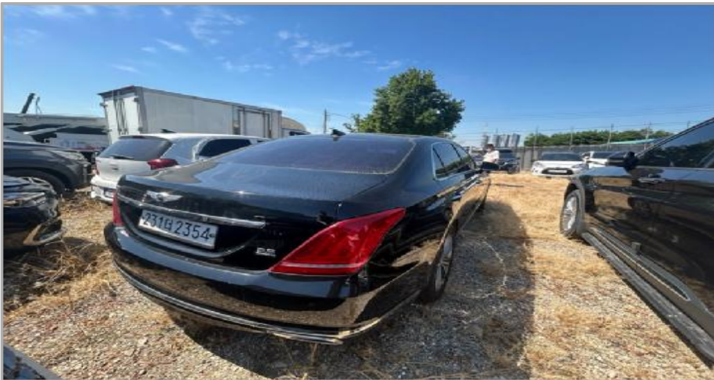
본건 전경 (후면)