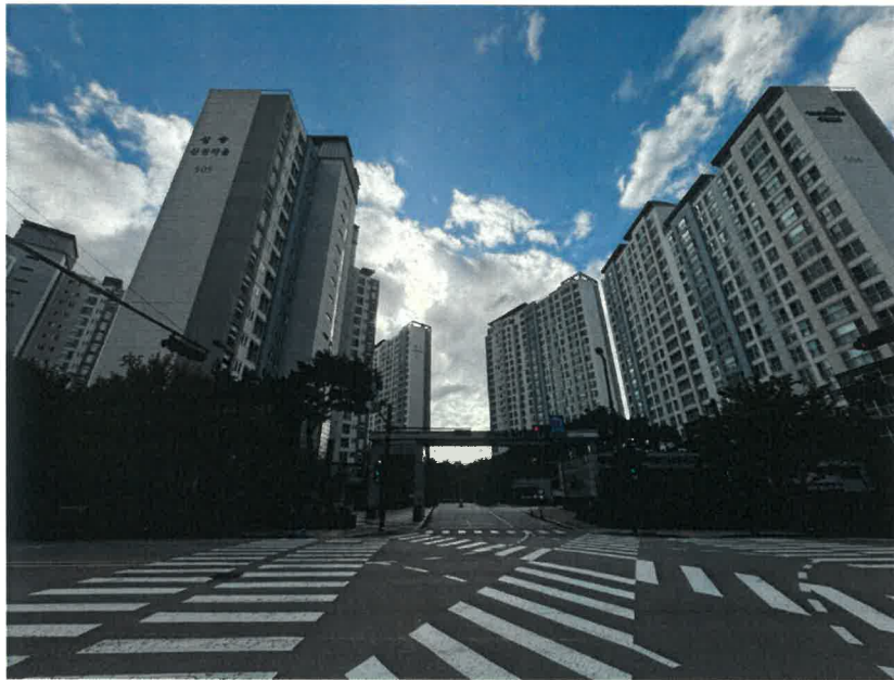
동측에서 바라본 아파트 정문(주출입구) 전경