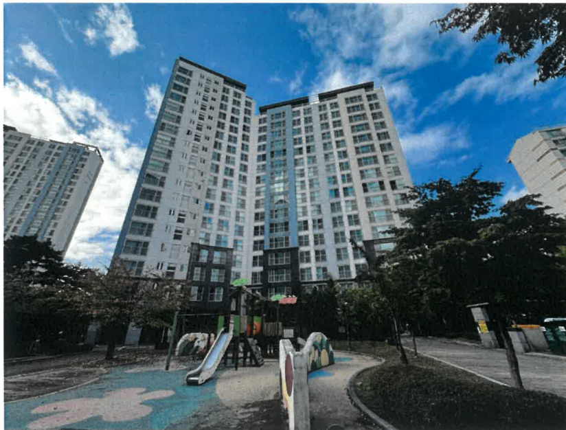
남측에서 바라본 본건 소재 제505동 전경