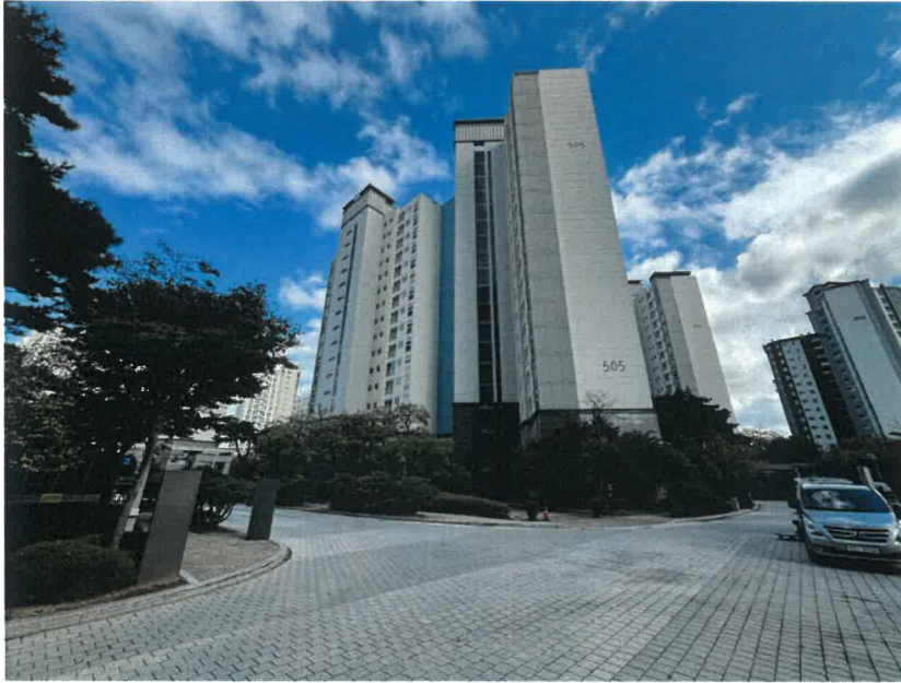
북서측에서 바라본 본건 소재 제505동 전경

경기도 고양시 덕양구 신원동 654 신원마을 5단지 우림필유아파트 제505동 제6층 제601호