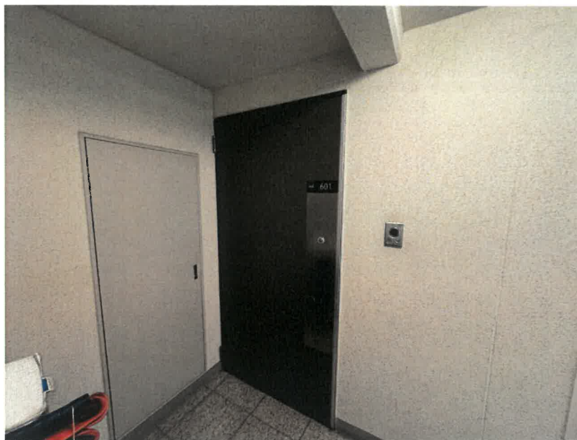
본건 현관 전경