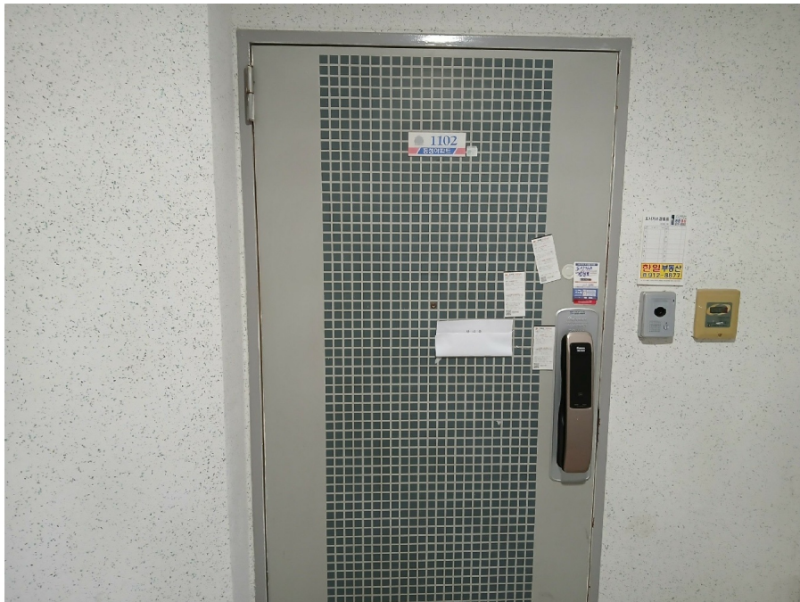
[ 1102 ]