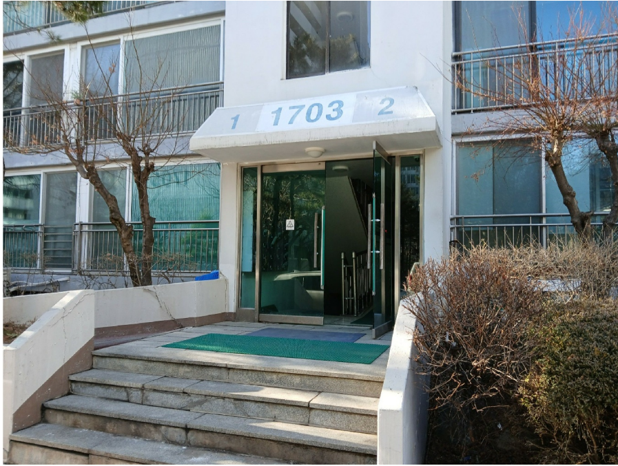
[ 1703 ]