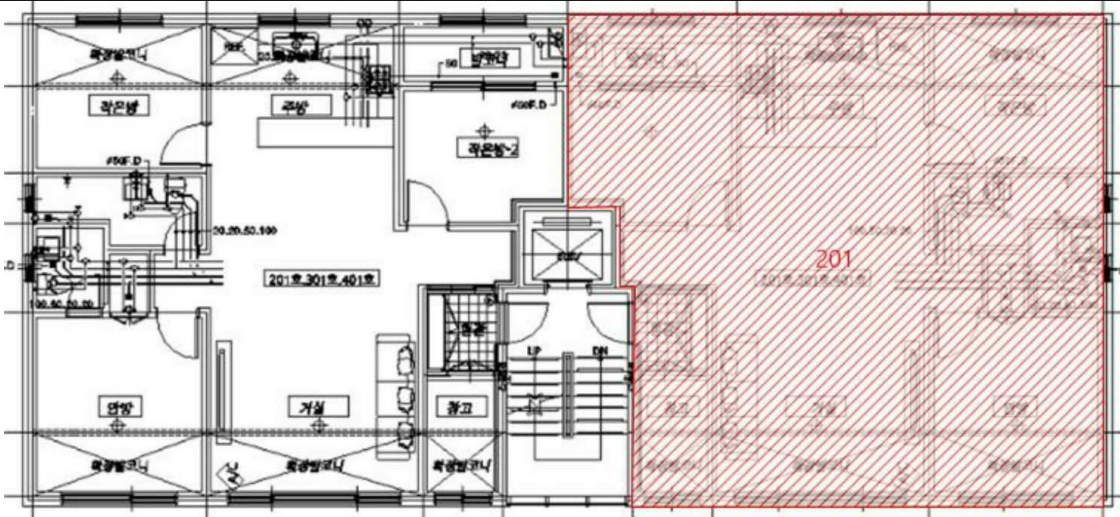
< 호별배치도 >

소재지 경기도 파주시 금촌동 288-38 락플러스 101동 2층 201호