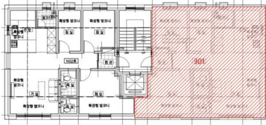
< 호별배치도 >