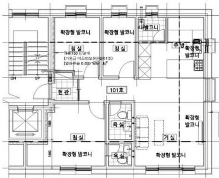
< 내부구조도 >