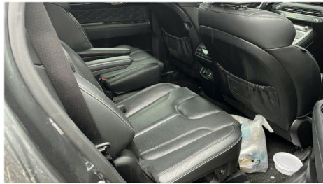
[본건 2열 부분]