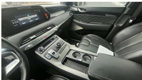
[운전석/조수석 및 기기조작 부위]