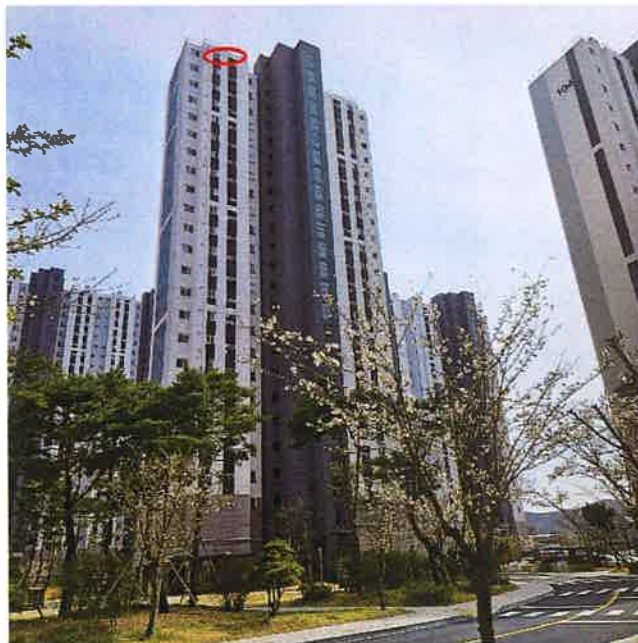
본건 전경(북측에서 촬영)