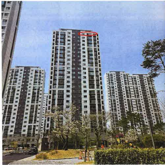
본건 전경(남동측에서 촬영)