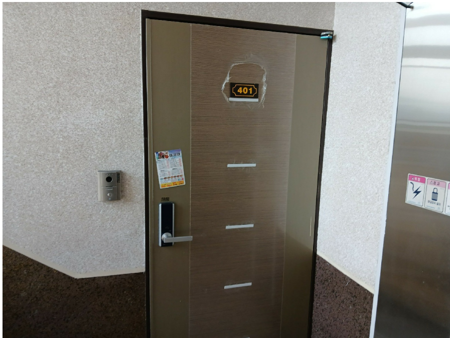
[ 401 ]