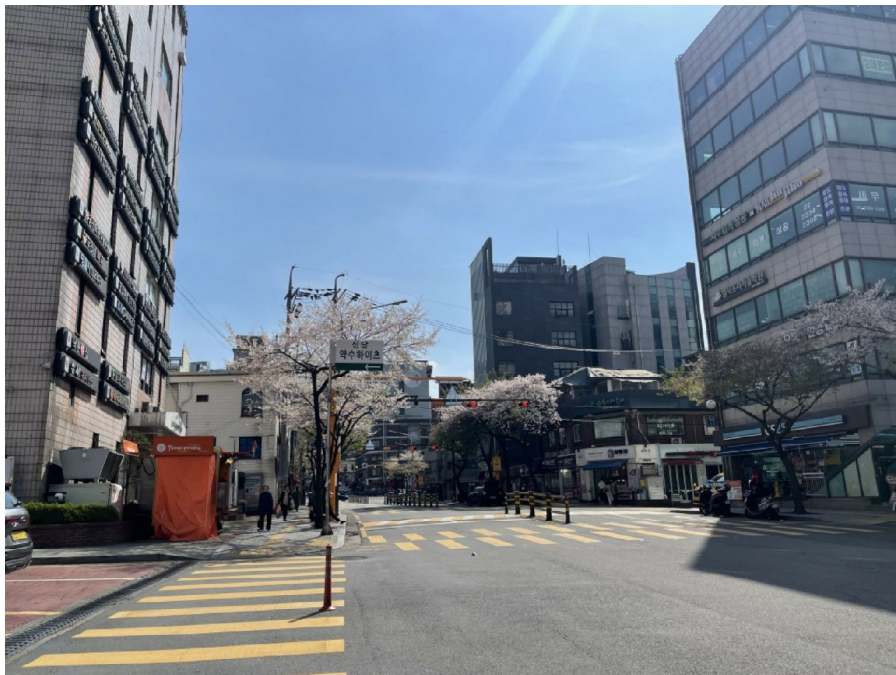
아파트단지 남서측 주변환경