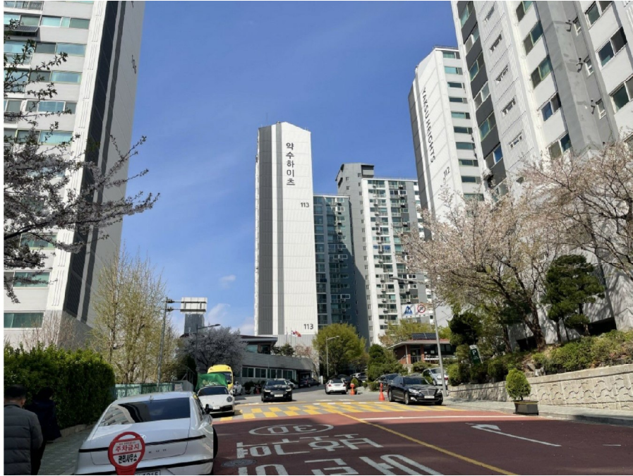
약수하이츠 113동 전경 및 주변환경