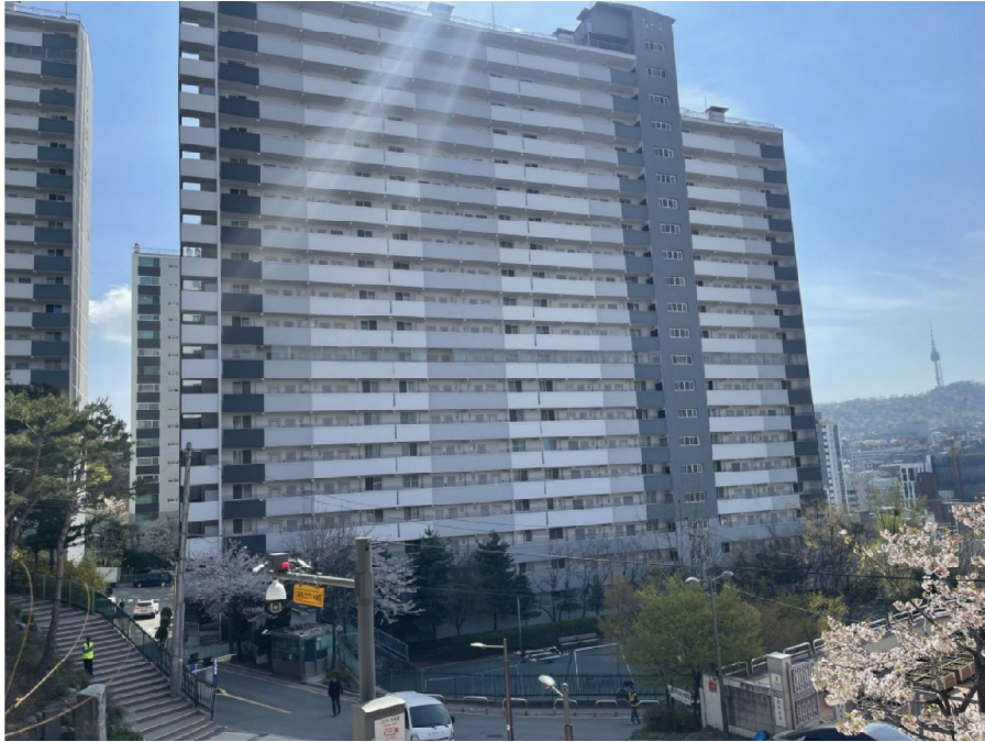
113동 북동측 전경