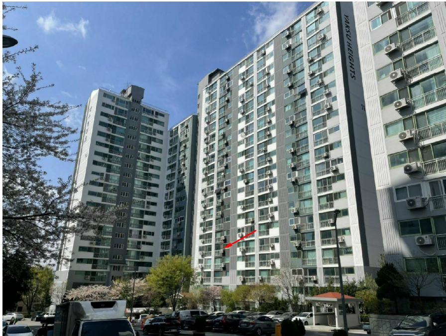
본건 남측 전경