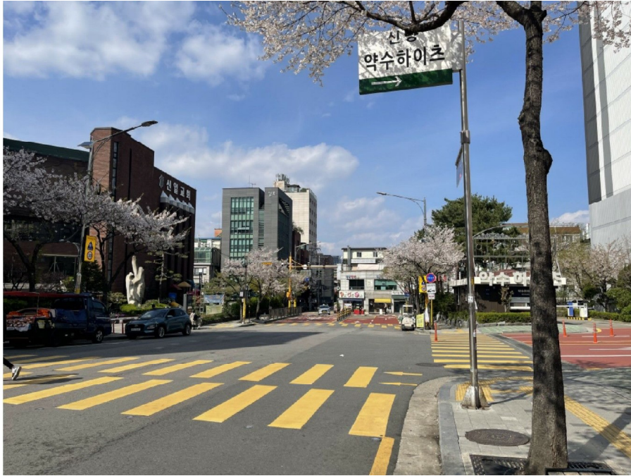
아파트 단지 접면도로 주변환경