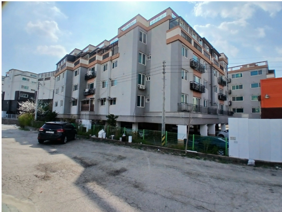
[ 102 (2) ]