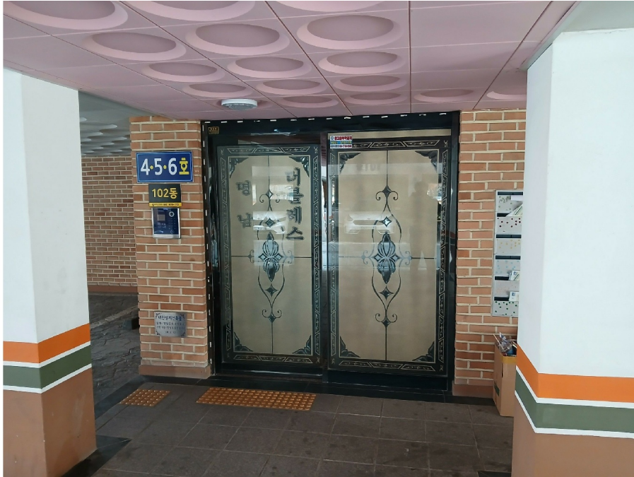
[ 102 ]