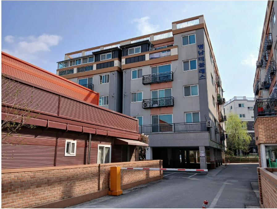
[ 102 (1) ]