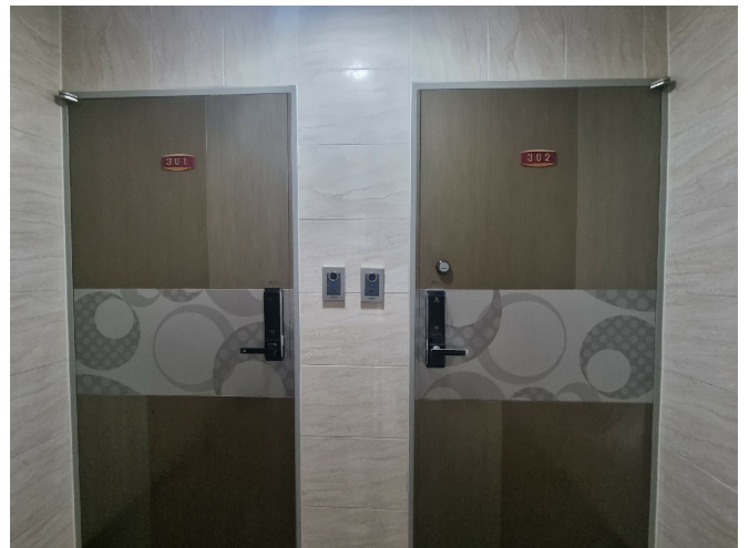
[ 3 302 ]