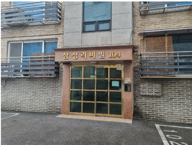
[ 1 ]