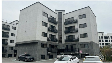
[본건 소재 공동주택 전경]