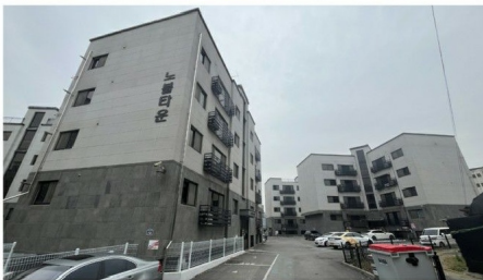
[단지 주출입구 및 단지내 전경]