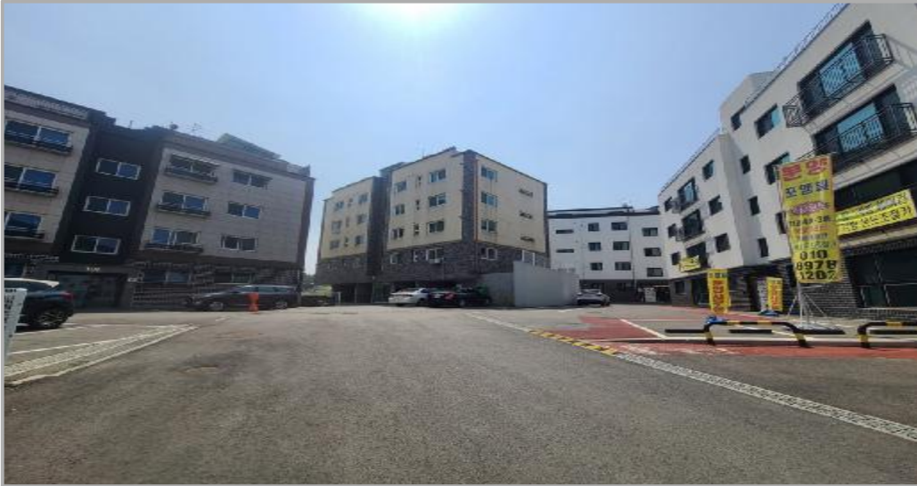
본 건물 전경 및 주위 환경