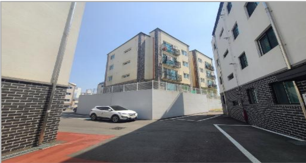
본 건물 전경 및 주위 환경