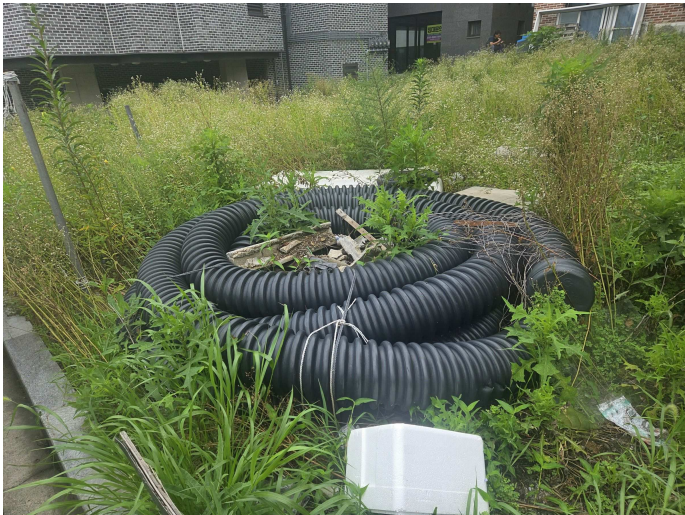
본건 지상 적치물