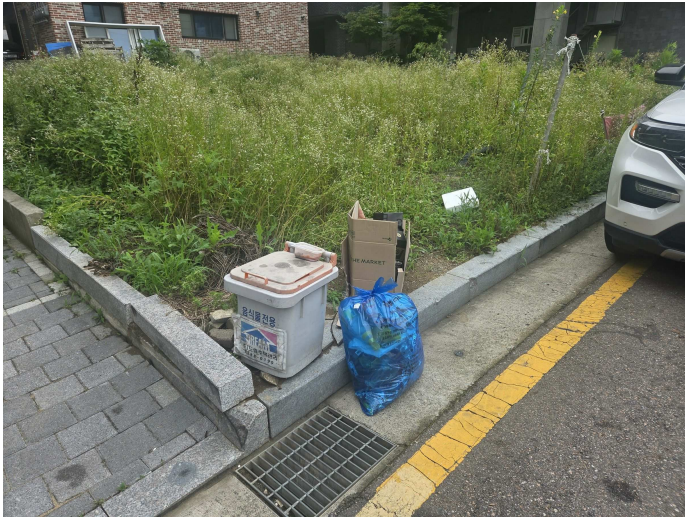
본건 지상 적치물