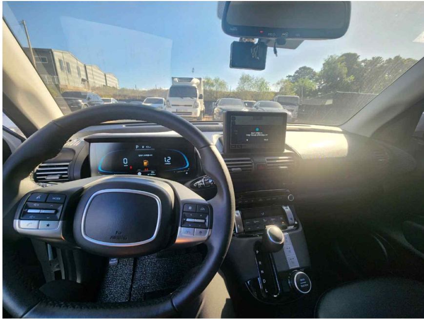
본 건 내부