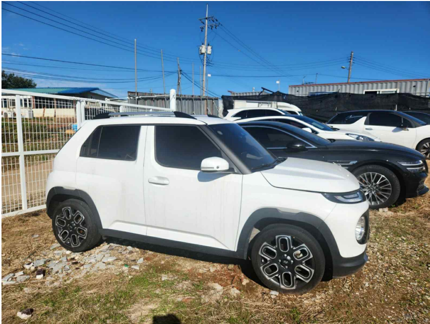
본 건 측 면