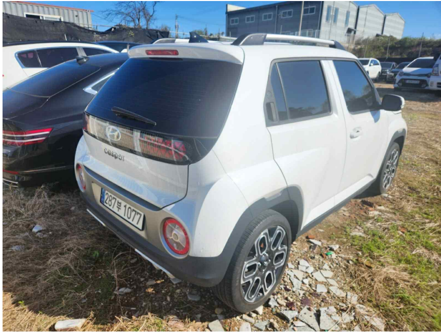
본 건 후 면