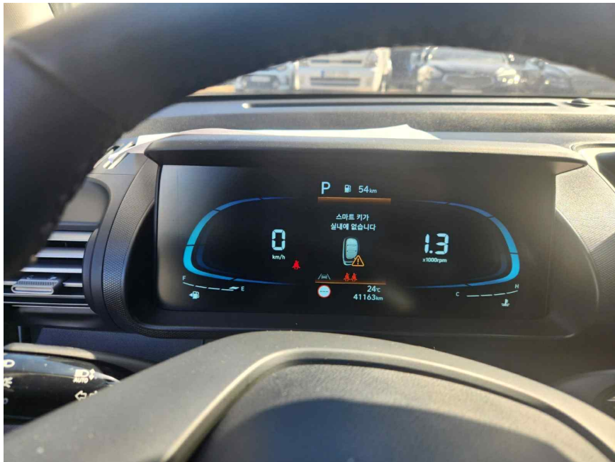
계 기 판(주행거리)