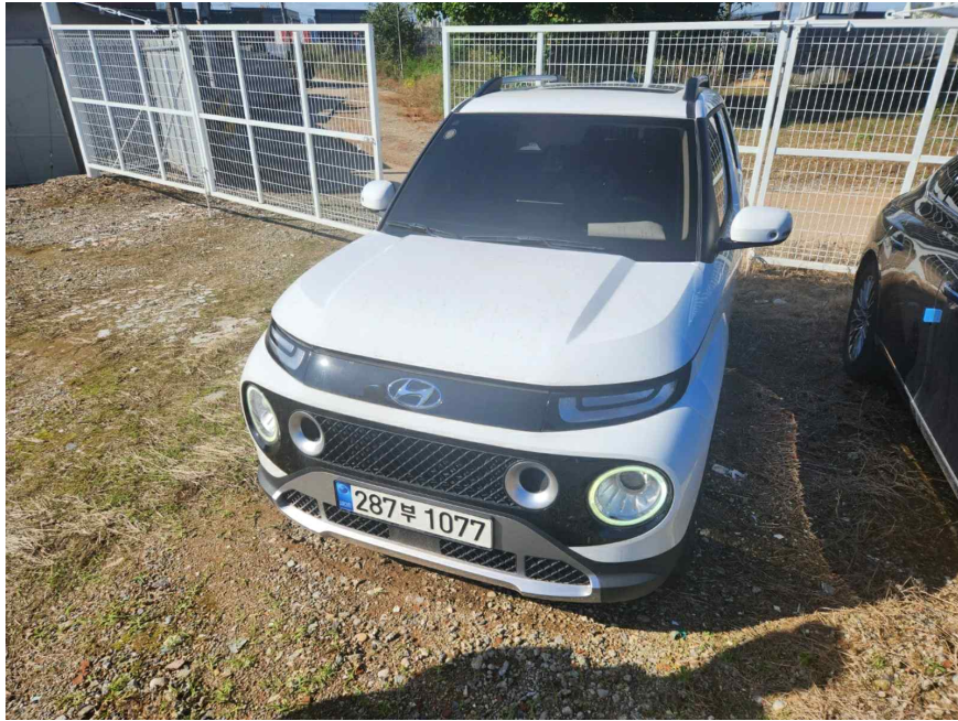
본 건 전 면