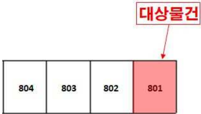
< 호별배치도 >