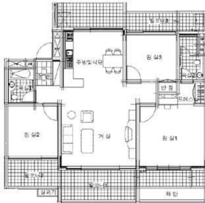
< 내부구조도 >