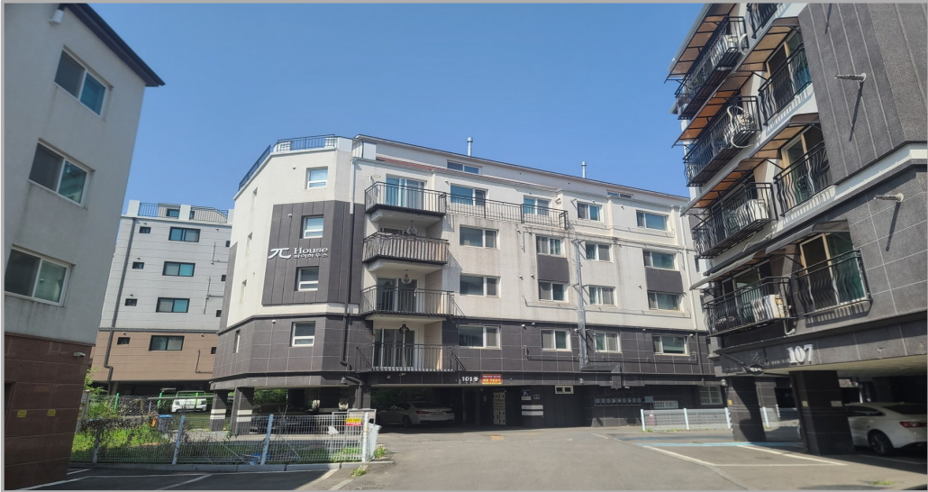
본 건물 전경