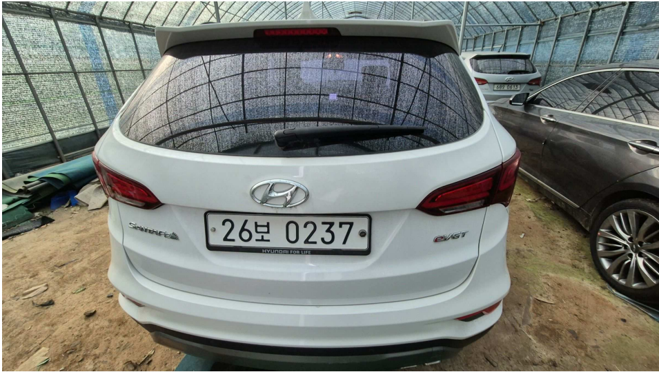
본건 자동차 뒷 모습