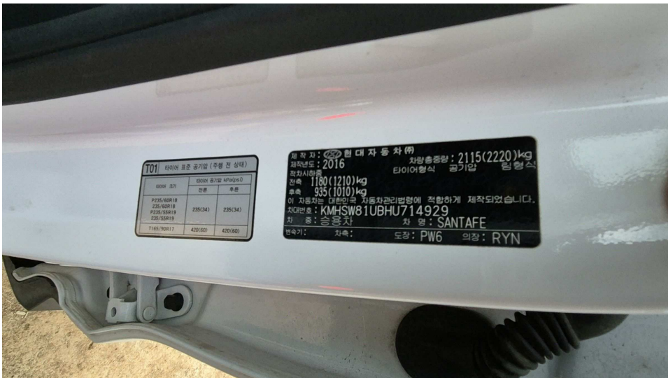
본건 자동차 차대번호 라벨 모습