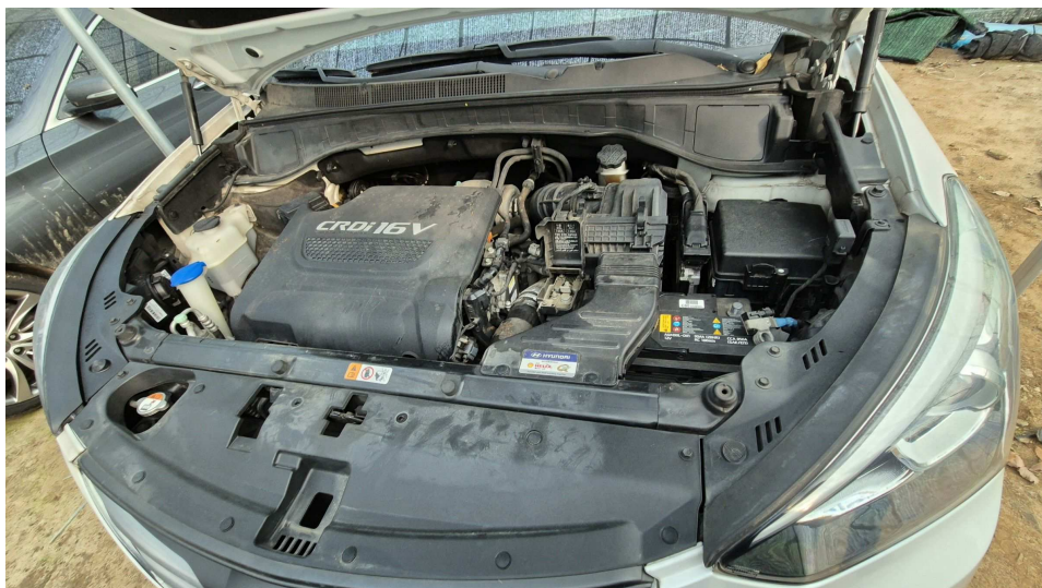
본건 자동차 엔진실 모습