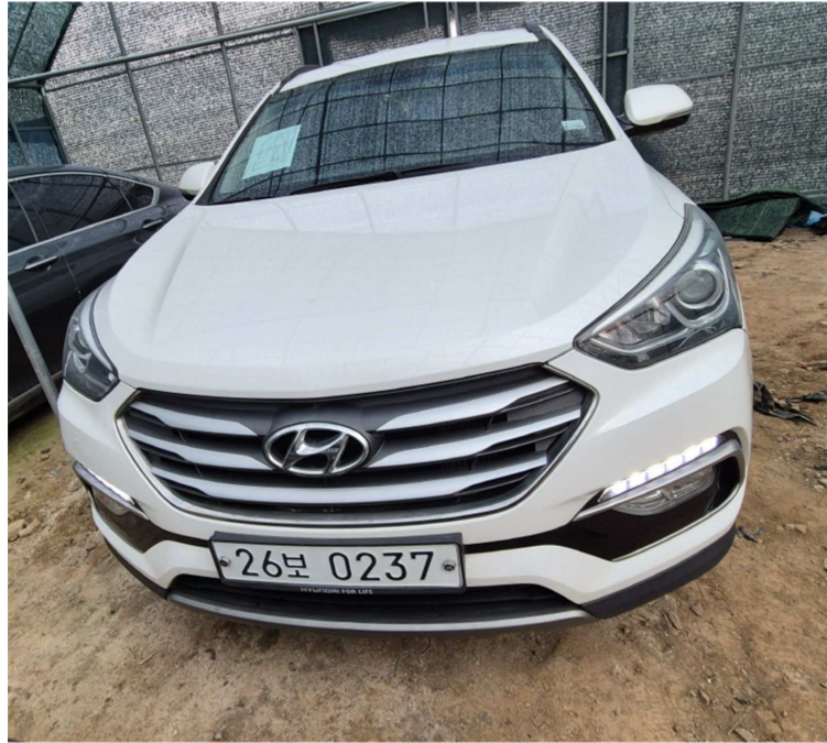
본건 자동차 앞 모습