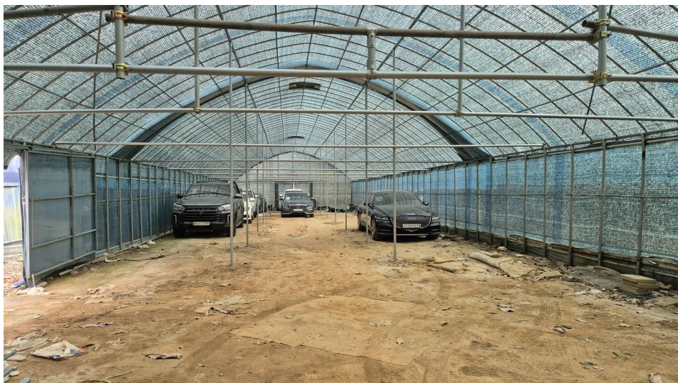
본건 자동차 보관장소 모습