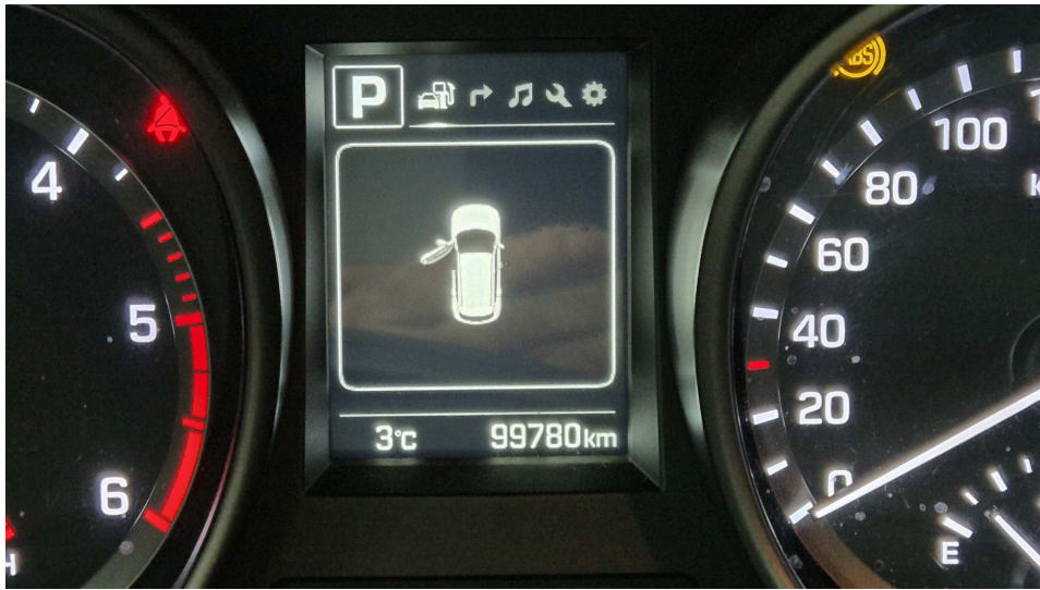
본건 자동차 주행거리 모습