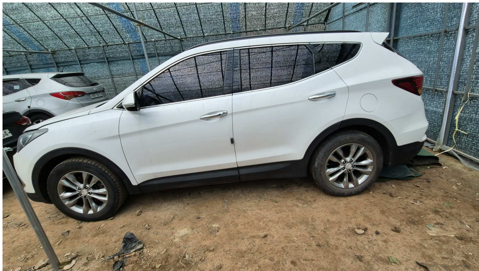
본건 자동차 옆 모습