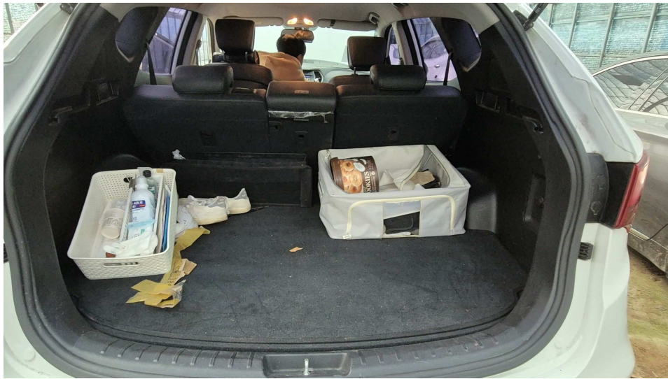
본건 자동차 트렁크 모습