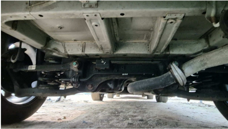
본건 자동차 차체하부 모습