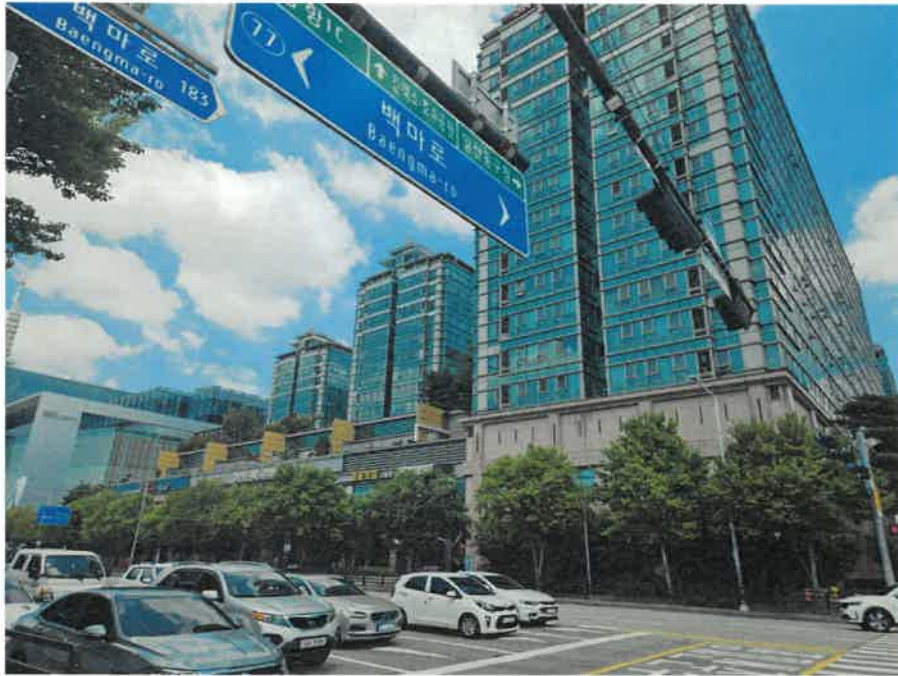
전체 건물 전경