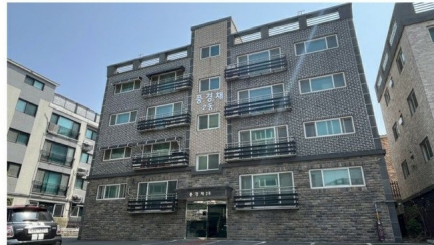
[본건 소재 다세대주택 전경]