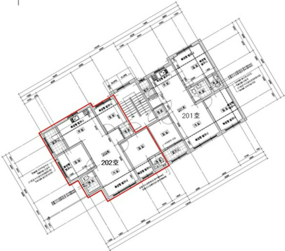
< 금강캐슬 제102동 제2층 제202호 >