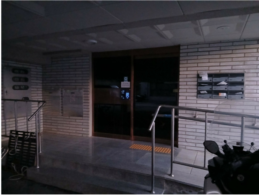
[ 2 ]