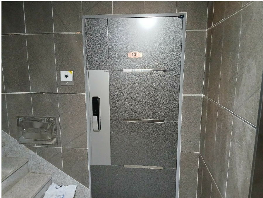
[ 101 ]