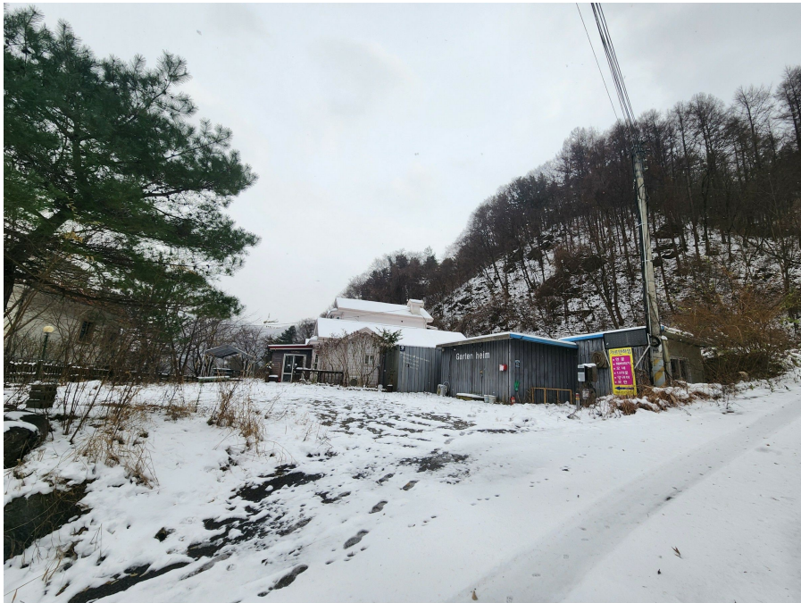
기호 1 토지 및 기호 2 건물