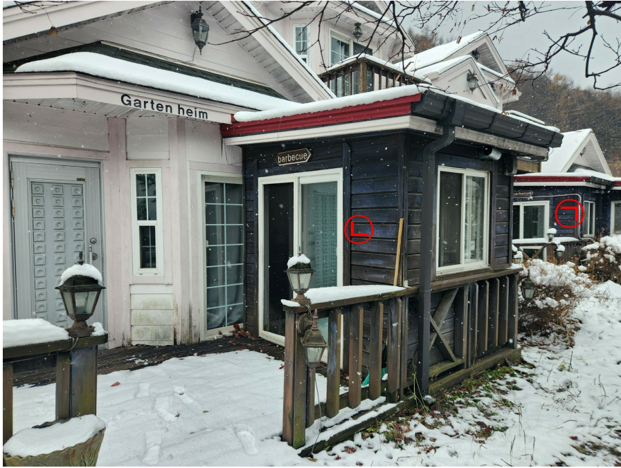
기호 2 건물 및 제시외건물㉠,㉡