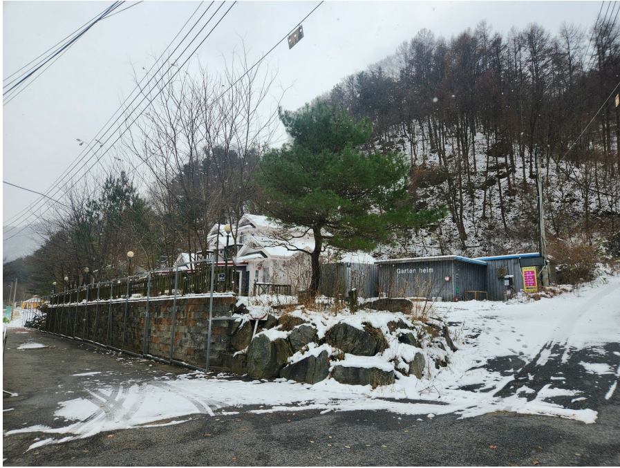
기호 1 토지 및 기호 2 건물