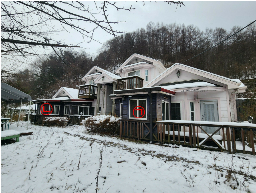
기호 2 건물 및 제시외건물㉠,㉡