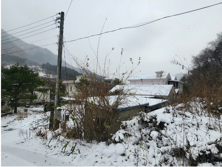
기호 1 토지 및 기호 2 건물