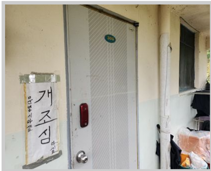
【 ( ) 】