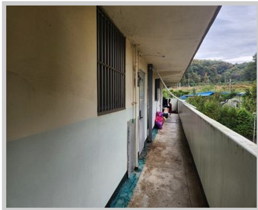
【 ( ) 】