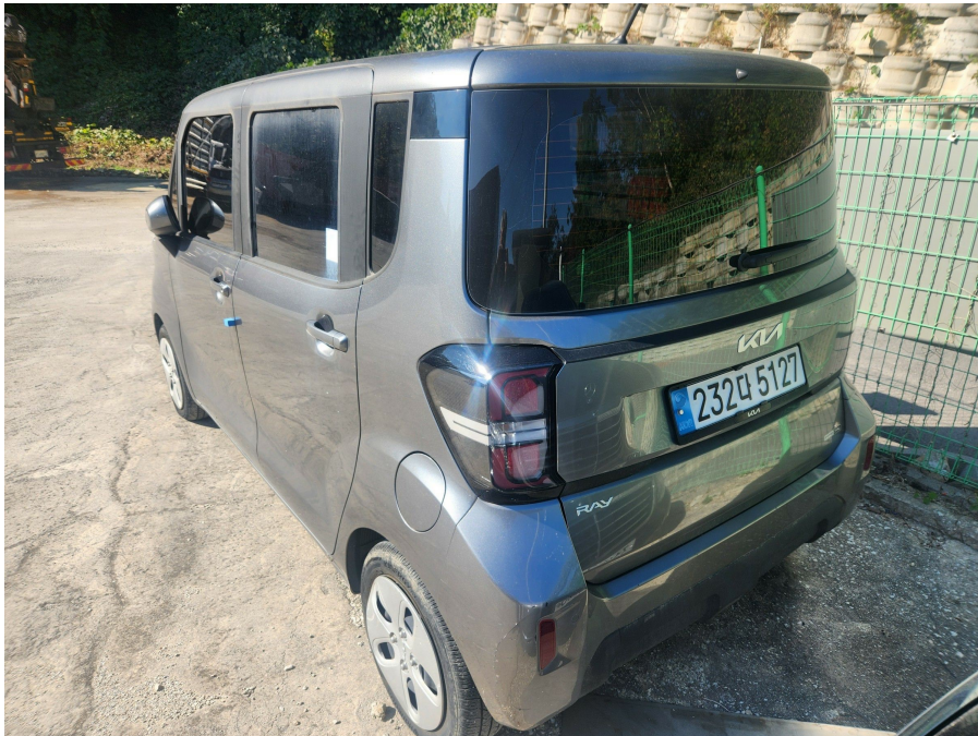
후면 및 측면 전경