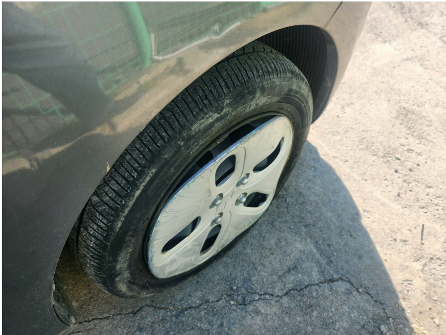
오른쪽 바퀴 힐