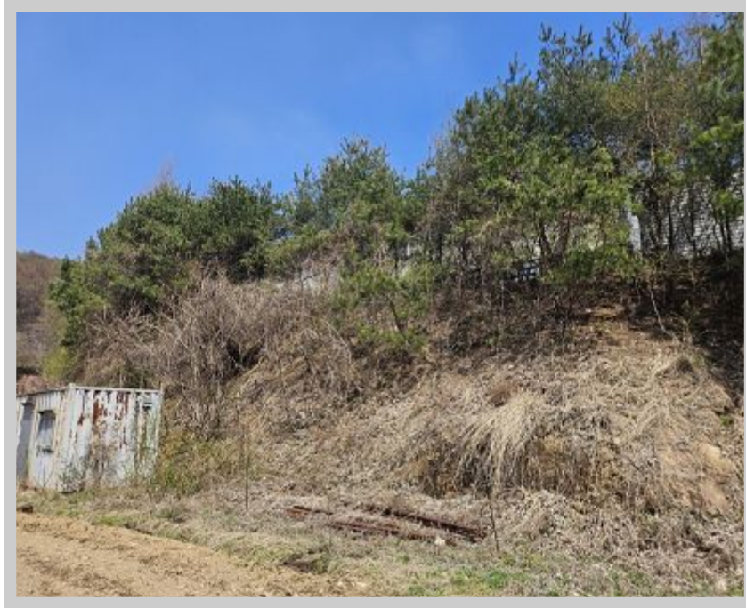
【 (1) 】