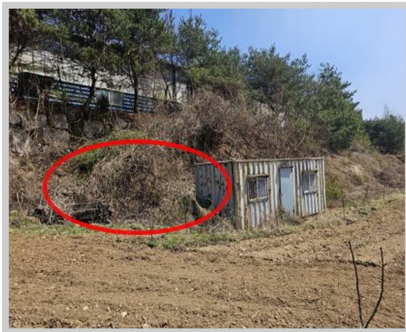
【 (2) 】