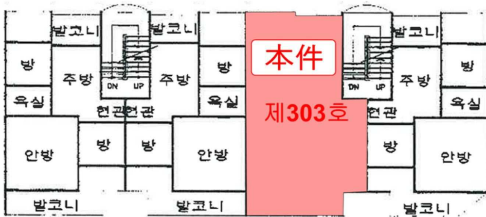
[ 기호 가 : 제3층 호별배치도 ]

※본건 내부구조는 이해관계인의 폐문 및 부재로 인하여 집합건축물대장 건축물현황도 등을 기준으로 하며, 일반적이고 표준적인 상황을 기준으로 함.