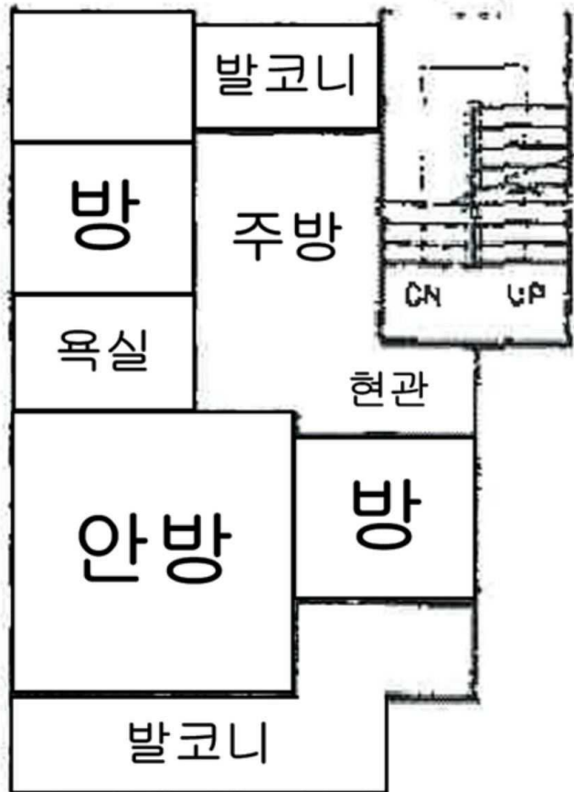
[ 기호 가 : 제3층 제303호 내부구조도 ]

※본건 내부구조는 이해관계인의 폐문 및 부재로 인하여 집합건축물대장 건축물현황도 등을 기준으로 하며, 일반적이고 표준적인 상황을 기준으로 함.